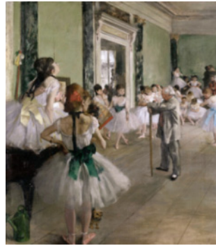
드가(Edgar Degas, 1834~1917, 프랑스), 발레 수업(캔버스에 유채, 85×75cm, 1874)