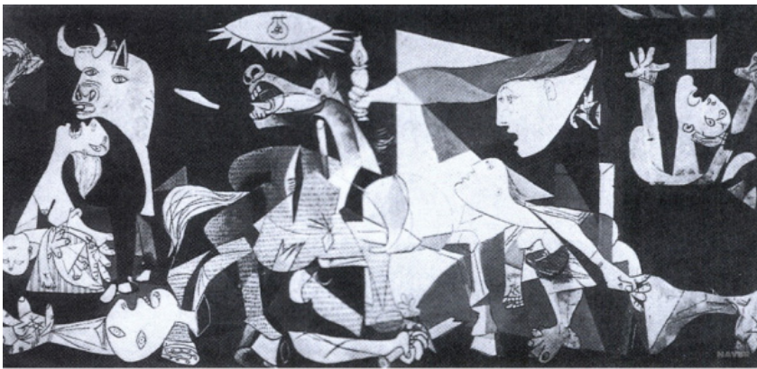
피카소(Pablo Picasso, 1881~1973, 스페인), 게르니카(캔버스에 유채, 349×776cm, 1937)

▶ 다음 작품을 제작하게 된 사회적 배경에 대한 설명으로 옳은 것은? [3.0점]