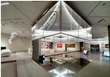
음성 해설이 적용된 전시 광경

국립현대미술관은 50주년 기념 전시에서 시각장애인을 위한 작품 감상 보조 자료를 제공한다고 밝혔다. 전시 관람 및 작품 감상에 제약이 있는 시각장애인들의 미술 문화 접근성을 높이고 전시장에서 작품을 감상하는 데 도움을 주고자 마련됐다. 특히 이번 시각장애인용 음성 해설은 국내 미술관 전시 관람을 위해 최초로 개발됐으며 한국시각장애인연합회 미디어접근센터 시각장애인 화면 해설 방송작가 15명이 개발에 참여했다.