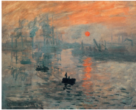
모네(Claude Monet, 1840~1926, 프랑스), 해돋이 인상(캔버스에 유채, 48×63cm, 1872)