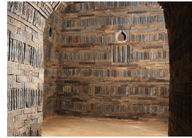
무령왕릉 내부 모습

무령왕릉에서는 무덤의 주인이 무령왕임을 알 수 있는 지식을 비롯하여 금제관식, 귀걸이, 목걸이, 팔찌, 고리장식 칼, 청동거울, 석수, 도자기, 오수전, 유리구슬, 다리미 등 다양한 유물이 출토되었습니다. 특히 중국의 영향을 받은 석수와 도자기를 비롯하여 일본산 금송으로 만든 목관, 태국 및 인도와의 교류를 의미하는 장신구 등이 발견되어 백제의 수준 높은 국제적 문화 교류 역량을 엿볼 수 있습니다.