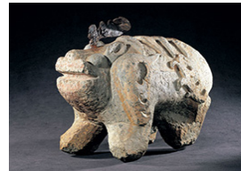
무령왕릉에서 출토된 석수

무령왕릉에서는 무덤의 주인이 무령왕임을 알 수 있는 지식을 비롯하여 금제관식, 귀걸이, 목걸이, 팔찌, 고리장식 칼, 청동거울, 석수, 도자기, 오수전, 유리구슬, 다리미 등 다양한 유물이 출토되었습니다. 특히 중국의 영향을 받은 석수와 도자기를 비롯하여 일본산 금송으로 만든 목관, 태국 및 인도와의 교류를 의미하는 장신구 등이 발견되어 백제의 수준 높은 국제적 문화 교류 역량을 엿볼 수 있습니다.