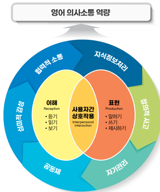
[그림] 영어과 역량 및 영역 구성

이에 2022 개정 영어과 교육과정에서는 지금까지 듣기, 말하기, 읽기, 쓰기의 네 가지 언어 기능 관점으로 교육 내용의 영역을 분류하던 기존 방식에서 탈피하여 언어의 사회적 목적 관점에 따라 ‘이해(reception)’와 ‘표현(production)’의 두 가지 영역을 설정하였다. 이해 영역에서는 담화와 글뿐만 아니라 이미지, 동영상 등이 다양하게 결합된 방식으로 제공되는 영어 지식 정보를 처리하고 사용하는 능력을 기른다. 표현 영역에서는 다양한 매체를 통해 말, 글, 시청각 이미지 등을 활용하여 자신의 느낌, 생각, 의견 등을 전달하는 능력을 기른다. 이해 영역과 표현 영역은 독자적인 영역으로 기능하는 한편, 두 영역의 결합된 형태로 영어 사용자 간 상호 작용도 가능하게 한다. 상호 작용은 대화, 토론, 문자 교환 등 참여자 간의 다양한 소통 방식으로 이루어질 수 있다. 영어과 역량 및 영역 구성을 정리하면 아래 그림과 같다.